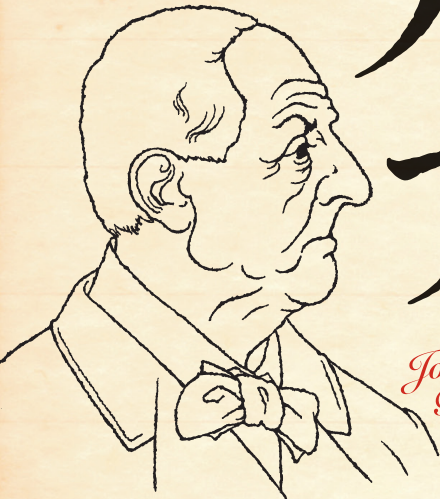
Joseph Anton Bruckner